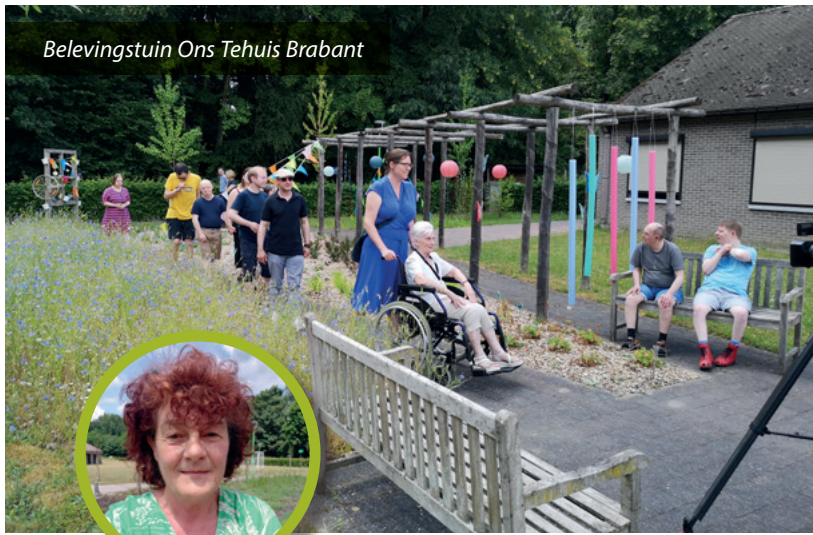
Belevingstuin Ons Tehuis Brabant

moeten we de natuur naar de zorginstellingen brengen! Dat was dan ook het doel van ons project 'De kracht van groen'. Gedurende anderhalf jaar gingen we aan de slag bij elf zorginstellingen om vergroening op hun domein te realiseren. We laten hen graag zelf aan het woord.