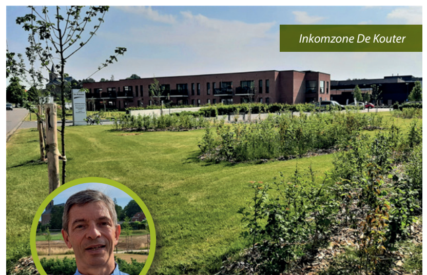
Inkomzone De Kouter