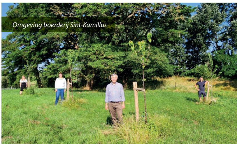
Omgeving boerderij Sint-Kamillus

ling van onze campus Krijkelberg, in het bijzonder de omgeving van onze boerderij, is daarom belangrijk. Ook onze patiënten profiteren daar uiteraard van. We willen in de toekomst trouwens ook een ont-haarpunt maken langs het nieuwe stuk fietssnelweg Leuven-Tienen dat langs Sint-Kamillus loopt. Van daaruit zullen bezoekers vrij ons domein op kunnen wandelen."