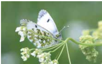
Oranjetipje - Anthocharis cardamines

Sommige insecten hebben een duidelijke voorkeur voor bepaalde plantensoorten: het elzahaantje (een klein, donkerblauw, glanzend kevertje) leeft uitsluitend op elzenstruiken; sommige galwespen hebben eiken nodig om hun eitjes te leggen; de meikever is in belangrijke mate achteruitgegaan door het verdwijnen van haagbeuk... Het voortbestaan van deze soorten is dus onlosmakelijk verbonden aan het lot van de waardplanten