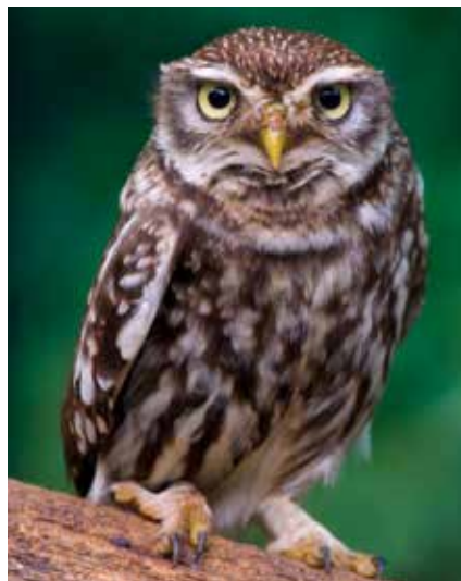
Steenuil - Athene noctua

De rijke variatie aan insecten, spinnen, slakken, wormen... die er te vinden is, vormt voor insectenetende vogels dan weer een feestmaal. Bramen maken van een houtkant soms een haast ondoordringbare muur. Met nog wat hondsroos, meidoorn of sleedoorn ertussen wordt het geheel een oninneembare vesting waar eitjes rustig uitgebroed