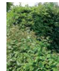
Gemengde haag met rode kornoelje en meidoorn

Tip: hoe breder de haag, hoe meer schuil- en nestgelegheid. Laat de haag dus minstens 70 cm breed worden.