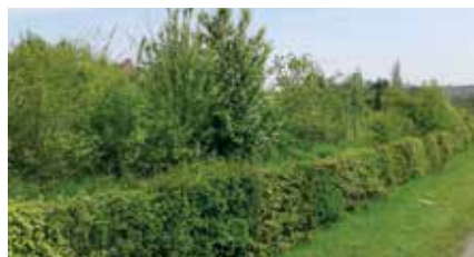
Geschoren haag met daarachter gemengde heg

Houtkanten, vogel- en nectarbosje: De eerste twee jaar na het planten beperkt het onderhoud zich tot het vrijhouden van de spilletjes of struikjes. Een goede mulchlaag van bijvoorbeeld gehakseld hout kan dit werk grotendeels opknappen, of je kiest bij aanplant voor inzaaien met klaver om de bodem te bedekken. Na twee jaar wordt de beplanting kort afgeknipt of afgezaagd, tot op ongeveer 15 cm boven de grond. Dit is winterwerk, wanneer de struiken bladerloos zijn. Uit de overblijvende slapende knoppen van het resterende stammetje lopen in de lente nieuwe scheuten uit. Deze scheuten mogen enkele jaren ongestoord hun gang gaan.