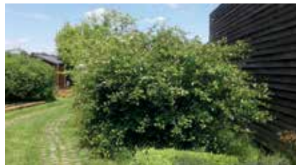
Heg met sleedoorn en bloeiende meidoorn