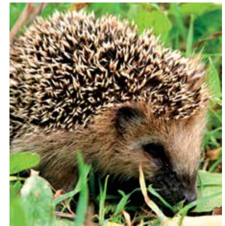
Egel - Erinaceus europaeus

Egels vinden onder een haag of houtkant beschutting en nestgelegenheid. Ze jagen 's nachts in de omliggende tuinen en akkers op slakken en grote insecten. Veldmuusjes en andere kleine knaagdieren hebben er ook hun plekje. Wezels gaan van hieruit op muizenjacht in het aanpalend landbouwgebied en ook dassen maken gebruik van heggen en houtkanten in de nabijheid van hun burchten. Vleermuizen gebruiken deze lijnvormige elementen in het landschap om zich te oriënteren.