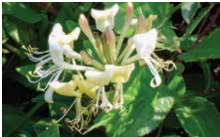
Wilde kamperfoelie - Lonicera periclymenum

Hagen, heggen en houtkanten zijn niet alleen een leefwereld voor dieren. Ook talloze kruiden en bloemen vestigen zich er spontaan. In echt oude hagen en houtkanten kan men typische bosplanten zoals bosanemoon, speenkruid en gevlekte aronskelk en ook heel wat klim- en slingerplanten aantreffen. Afhankelijk van de rijkdom van de grond kan je er wilde kamperfoelie, hop, bitterzoet, klimop en heggerank vinden. Wilde kamperfoelie trekt met zijn welriekende bloemen op zijn beurt voornamelijk nachtvlinders aan omdat de plant zijn zoete geur pas bij valavond verspreidt.