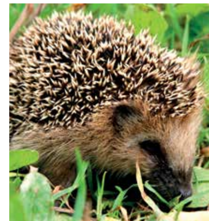
Egel - Erinaceus europaeus

Egels vinden onder een haag of houtkant beschutting en nestgelegenheid. Ze jagen 's nachts in de omliggende tuinen en akkers op slakken en grote insecten. Veldmuisjes en andere kleine knaagdieren hebben er ook hun plekje. Wezels gaan van hieruit op muizenjacht in het aanpalend landbouwgebied en ook dassen maken gebruik van heggen en houtkanten in de nabijheid van hun burchten. Vleermuizen gebruiken deze lijnvormige elementen in het landschap om zich te oriënteren.