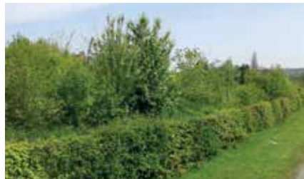
Geschoren haag met daarachter gemengde heg

Houtkanten, vogel- en nectarbosje: De eerste twee jaar na het planten beperkt het onderhoud zich tot het vrijhouden van de spilletjes of struikjes. Een goede mulchlaag van bijvoorbeeld gehakseld hout kan dit werk grotendeels opknappen, of je kiest bij aanplant voor inzaaien met klaver om de bodem te bedekken. Na twee jaar wordt de beplanting kort afgeknipt of afgezaagd, tot op ongeveer 15 cm boven de grond. Dit is winterwerk, wanneer de struiken bladerloos zijn. Uit de overblijvende slapende knoppen van het resterende stammetje lopen in de lente nieuwe scheuten uit. Deze scheuten mogen enkele jaren ongestoord hun gang gaan.