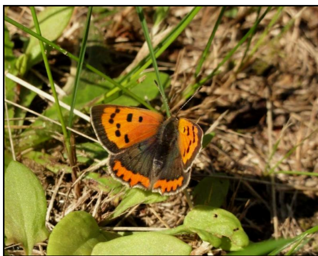
De Kleine vuurvliinder is een interessante verschijning in de bermen van de Ruelensvest. Deze soort geeft aan dat er ook schralere leefmilieus zijn in de stad, al zijn ze er zeldzaam.

Schralere stedelijke milieus bieden specifieke kansen voor het stedelijk natuurbeleid. Het groenbeheer dient hier dus rekening mee te houden. De voorbije jaren hebben de stadsdiensten in samenspraak met Natuurpunt het beheer aan de Ruelensvest bijgestuurd met het oog op natuurontwikkeling. Een minder intensief maai-beheer en verschraling zorgen er voor dat vlinders en andere dieren meer kansen krijgen.