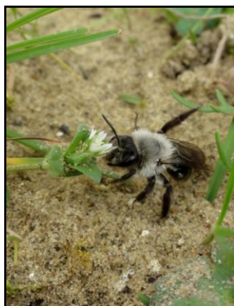
De Gewone wolzwever (links) en de Grijze zandbij (rechts).