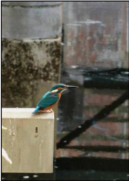
De Isvogel... ook in de binnenstad.