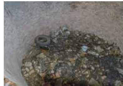
Huisafval en puin - RLD