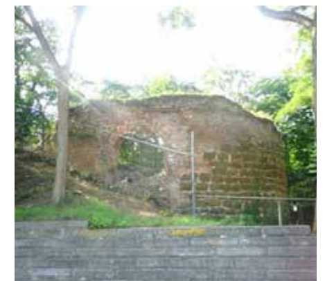
Verloren Kosttoren onderbouw in 2014 - LHG

In het begin van de 18de eeuw sloot men gevangenen in de toren op en in 1783 werden twee verdiepingen van de toren als poedermagazijn gebruikt. In 1787 werd de toren verkocht om te worden afgebroken . Tijdens de eerste wereldoorlog werden op de Mechelsevest nivellingswerken uitgevoerd. Hierdoor kwam de onderbouw van de Verloren Kost gedeeltelijk bloot te liggen. Eind 20ste eeuw speelde men nog rond de open torensoekel .