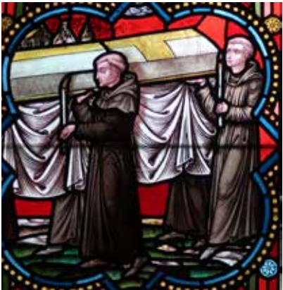
Alexianen en zorg voor begraafing – Glasraam kapel