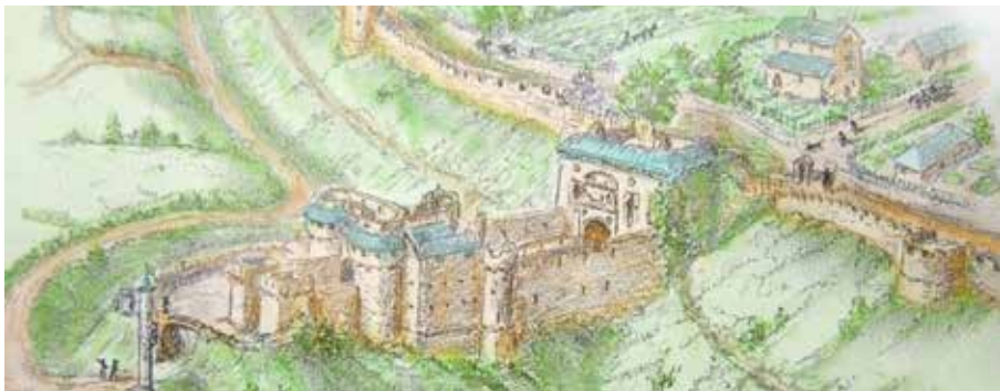
Tweede ringmuur, ca. 1600 – J. Halfants

Het huidige landschap van de E. Remyvest heeft ooit een ander heel uitzicht gehad. Nadat de eerste ringmuur van Leuven te klein was geworden voor de uitbreidende stad en de verdediging door het grotere bereik van kanonnen moest aangepast worden, werd rond 1360 de tweede ringmuur voorzien, die over huidige vesten liep.