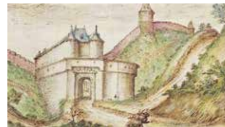
Zicht op de Brusselsepoort, veldzijde Brusselsepoort (1650) - Kon. Bib.