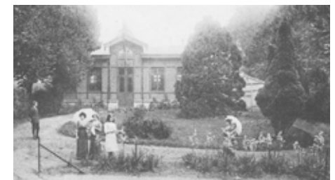
Zicht op de Schietstand aan de Brusselsepoort, veldzijde (begin 20e eeuw) - Leuven Weleer