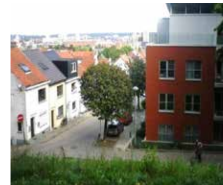
Stadsgezicht Luibank gehalveerd

De Mannenstraat , die naar de vesten liep voor de toegang tot de velden, werd eveneens na de aanleg van het nieuwe academisch ziekenhuis op de Gasthuisberg omgevormd tot een brede laan, de Mgr. Van Waeyenberghlaan . Deze liep onder de vesten naar de 'Gasthuisberg'. Over deze laan heen, en verder over het nieuwe Van Waeyenberghpark , kan men de stad aanschouwen.