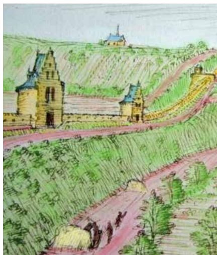
Ringmuur en zone Remyvest, ca. 1615

dankzij subsidies van mecenas en industrieel Edouard Remy . Dit verschaftte werk aan de werkloze bouwvakkers, die de verdere slooping van de stadswallen realiseerden.