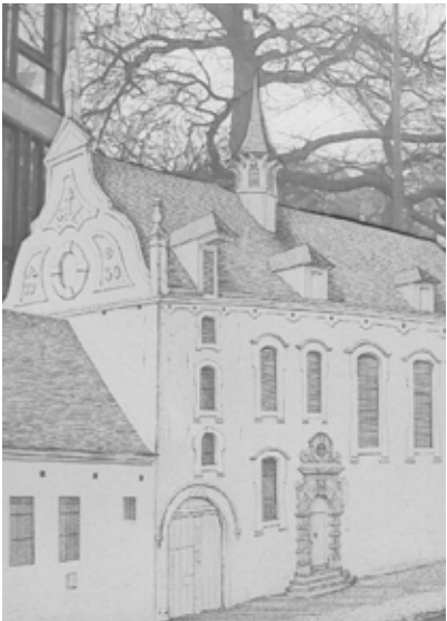
Simulatie eerste klooster in de Brusselsestraat – LHG

De cellenbroeders of broeders alexianen , met Sint-Alexus als patroonheilige, werkten vooral rond de verzorging van pestlijders, dodenbegraving, mensen in nood, psychische patiënten en bejaarden. Het eerste klooster werd opgericht in de Brusselsestraat , maar het brandde echter af in 1889.