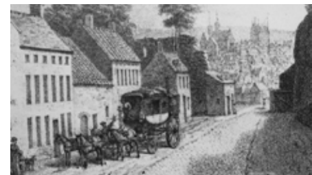
Zicht op de Brusselsepoort, veldzijde voor 1825