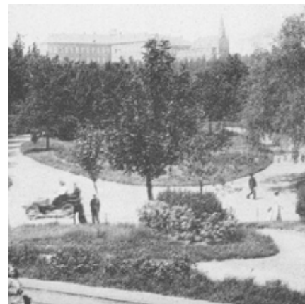
Remyvest begin 20ste eeuw – Leuven Weleer

Einde 19de eeuw werd een nieuwe parkaanleg voor een promenade uitgewerkt in laat-romantische stijl. De ontwerper van dienst was Pierre Livin Rosseels , telg van een Leuvense tuinarchitectenfamilie. Het deel tussen de Tervuurse- en Brusselsepoort werd op 1890 ingehuldigd en naar de weldoener Edouard Remy vernoemd. De stedelijke Kruidtuin nam het onderhoud van deze vesten ter harte, totdat de Provincie Brabant in 1971 het beheer ervan kreeg.