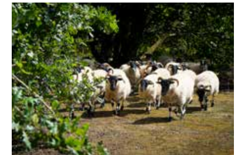
Schape in de boomgaard - RLD

Sinds 2014 sloegen UZ Leuven en Regionaal Landschap Dijleland de handen in elkaar om het park terug op te waarderen en beter te ontsluiten voor publiek . De afgelopen jaren werd de boomgaard hersteld en werd het bos uitgedund en uitgebreid met een bosrand . Ook voor de komende jaren staan nog allerhande werken gepland die het park naar een hoger niveau moeten tillen. [LHG-RLD]