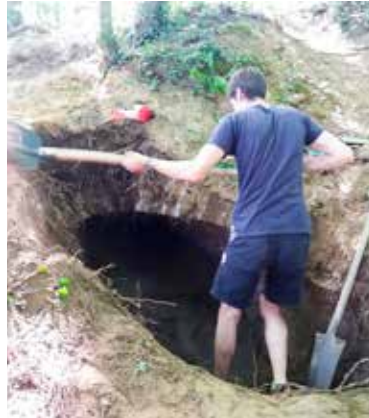
Blootleggen van de ijskelder - RLD

De stadsijkelder is gelegen aan het linker tolhuis van de Brusselsepoort te Leuven, niet ver van de alomgekende "luibank". Beide tolhuizen en de ijskelder dateren van 1825 . De architect was Hensmans. Voor de bouw van beide tolhuizen en ijskelder werden 200.000 bakstenen gebruikt. De bedoeling was gedurende het gehele jaar ijs te voorzien voor hospitalen, leger, dokters en tandartsen. Ijs is een koortswerend en verdovend middel. Ook handelaars en particulieren konden hier ijs kopen. Het ijs was in eerste instantie afkomstig van een vijver aangelegd aan de Brusselsevest . Later werd het ijs uit de Vaartkom gehaald. De ijskelder raakte rond 1900 in onbruik door de opkomst van de ijsfabrieken.