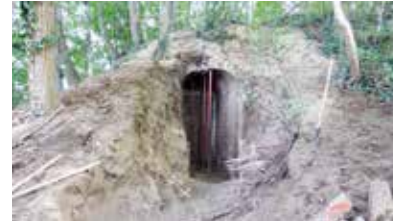
Ingang diep versholen - RLD