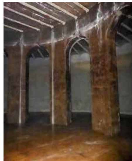
Binnenzijde van het waterreservoir - RLD

Nadat dit oorspronkelijke waterreservoir werd vervangen door nieuwere watertorens stond het geruime tijd leeg. Regionaal Landschap Dijleland gaf het reservoir afgelopen jaar een nieuwe bestemming door het in te richten als winterverblijfplaats voor vleermuizen. [RLD]