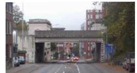
Zicht op Brusselsepoort veldzijde 2016, na de aanleg viaduct rond 1975