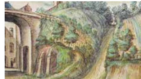
Zicht op de Brusselsepoort, stadszijde Mechelsevest (1615)