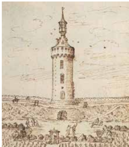
Verloren Kosttoren stadsszijde 1615 - Kon. Bib.

1400 met een hoogte van zeven meter. Het werd verder verhoogd tussen 1462 en 1470 met middendeel en lantaarn.