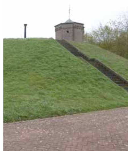
Buitenzijde van het waterreservoir - RLD