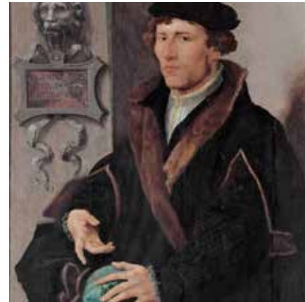
Gemma Frisius, door M. van Heemskerck

In de eerste helft van de 15de eeuw berekende cartograaf Gemma Frisius , docent wiskunde en astronomie aan de Leuvense universiteit, vanuit de Verloren-Kosttoren de afstanden tussen de steden volgens de driehoeksmeting.