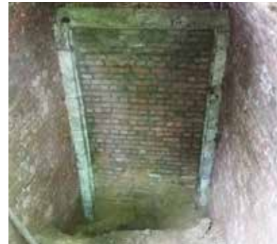
Dichtgemetselde deur - RLD