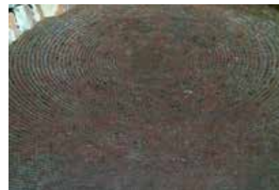
Prachtige koepel - RLD

De ijskelder is een echte parel van architectuur . De kelder heeft de vorm van een omgekeerd ei . De hoogte van de koepel is 2.5m en heeft een doorsnede van 5,6m. De hoogte van de gehele ijskelder is ongeveer 7m. De ijskelder was toegankelijk via een meterslange gang .