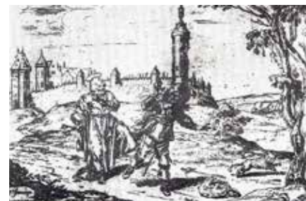
Sint-Pieter verjaagt de belegeraars - Ets, P. Franchoys, 1635

De toren zou zijn nut in 1635 bewijzen bij het Beleg van Leuven door de Fransen en Hollanders. Zij vielen aan langs de zwakste zijde van de stad. De Verloren Kosttoren werd zwaar beschoten en beschadigd, maar bleef overeind. Het Beleg werd enkele dagen later, gezien de weerstand vanuit de stad Leuven, om nog duistere redenen opgegeven.