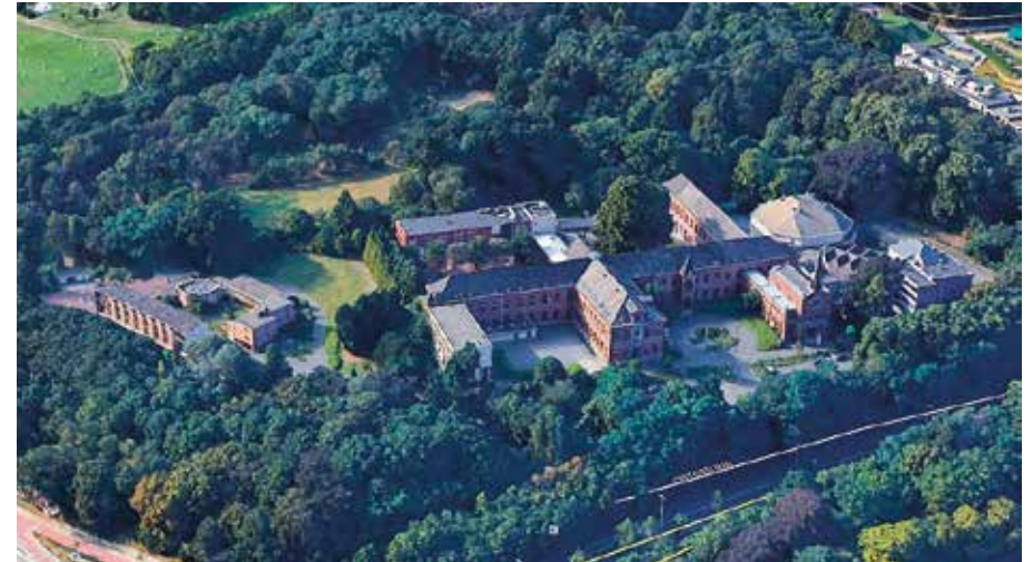
Luchtfoto, klooster op heuvel anno 2017

In 1963 bereikten de alexianen een akkoord met het aartsbisdom om hun klooster af te staan in ruil voor een nieuwbouw in Boechout. Ze gaven hun kunstwerken in bruikleen aan het Stedelijk Museum in Leuven.