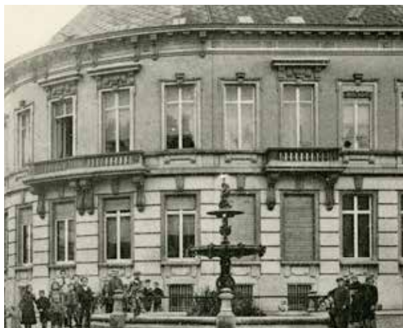
Waterfontein op het Brabantplein

Oorspronkelijk was drinkwater in Leuven afkomstig van bronnen, poelen en open waterputten. In de 18e eeuw werden in het oostelijke en verhevenste gedeelte van de stad monumentale arduinen pompen , waarvan er enkele nog steeds bestaan, op de waterputten geplaatst. In de 19e eeuw nam dit aantal nog verder toe. Door de insijpeling van met menselijke fecaliën besmet water afkomstig van de gebrekkige beerputten en mesthopen, die weinig of niet werden geruimd, raakten ook deze putten vaak verontreinigd met de cholera bacil. Bovendien stonden tijdens hete zomers deze putten veelal droog .