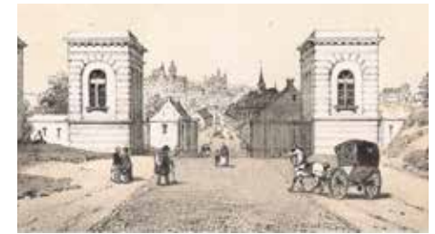
Zicht op de Brusselsepoort, veldzijde na 1825 Leuven Weleer