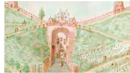
Zicht op de Brusselsepoort, stadszijde (1615)

Rond 2000 werd het noordelijke tolhuis volledig gerestaureerd op initiatief van de Architectenkamer voor Vlaams-Brabant. Het zuidelijke tolhuis heeft echter geleden onder de leegstand en werd recent voorlopig hersteld na de instorting van het dak. Dit tolhuis wacht nog op een nieuwe gebruiker. Hopelijk kan dit weinig fraaie verkeersknooppunt ooit een aantrekkelijkere uitwerking krijgen dat aansluit bij het Alexianenpark aan de overzijde. [LHG]