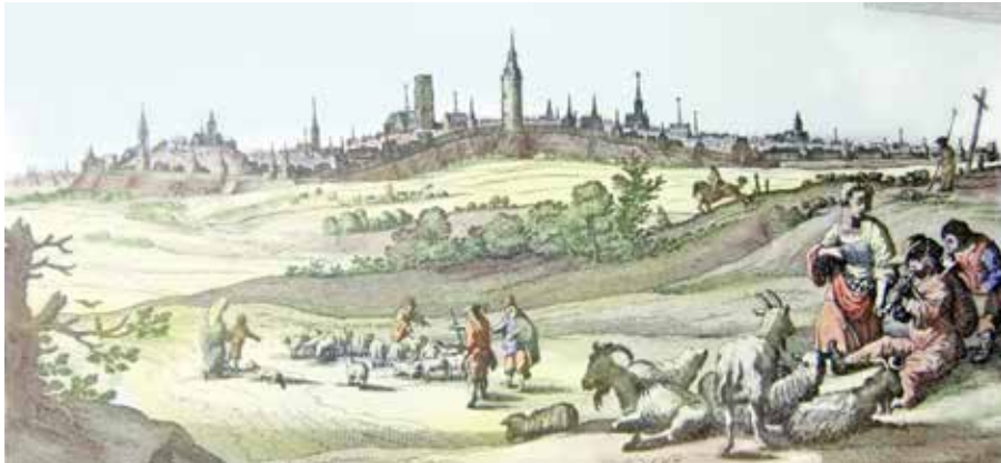
Zicht op de stad met de Verloren Kosttoren – Harrewyn 17de eeuw

Tussen de Wijngaardpoort, huidige Brusselsepoort, en de Mechelsepoort lag halverwege een legendarische waltoren. Vele oude prenten tonen deze Verloren Kosttoren als belangrijk onderdeel van het prestige van de stad Leuven.