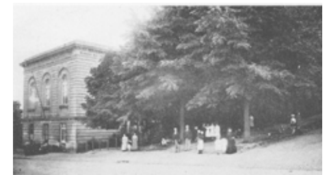
Zicht op de Brusselsepoort, veldzijde 1900 Leuven Weleer