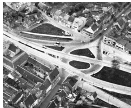
Sluiting ring ca. 1975 - Leuven Weleer

Einde 19de eeuw werd een nieuwe parkaanleg voor een promenade uitgewerkt in laat-romantische stijl. De ontwerper van dienst was Pierre Livin Rosseels , telg van een Leuvense tuinarchitectenfamilie. Het deel tussen de Tervuurse- en Brusselsepoort werd op 1890 ingehuldigd en naar de weldoener Edouard Remy vernoemd. De stedelijke Kruidtuin nam het onderhoud van deze vesten ter harte, totdat de Provincie Brabant in 1971 het beheer ervan kreeg.